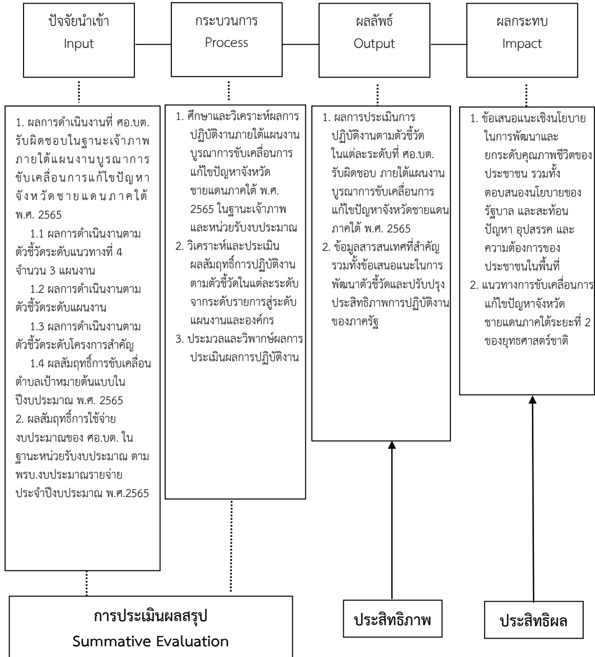
ภาพที่ 3-1 กรอบแนวคิดในการประเมินผลการปฏิบัติงาน

กรอบแนวคิดในการประเมินผลการปฏิบัติงานแก้ไขปัญหาลำพูนจังหวัดชายแดนภาคใต้ ภายใต้แผนงานบูรณาการขับเคลื่อนการแก้ไขปัญหาลำพูนจังหวัดชายแดนภาคใต้ ประกอบด้วย